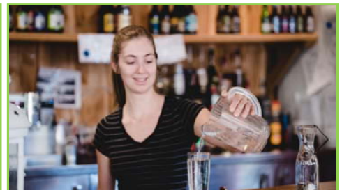
Étude de marché participative

Nous avons réalisé un excellent taux de maintien à l'emploi étant donné que 100% des participants ont répondu aux critères du programme, alors que les 42 participants sont toujours à l'emploi ou retournés aux études.